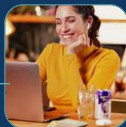
Natural Tea Brasil